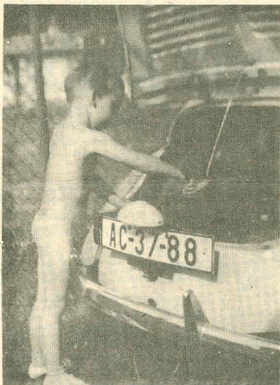
Vítězný snímek z naší fotosoutěže. Autorem je člen Václav Žížala.

když je vůz totiž /lhostejno zdali nožní brzdou nebo účinkem motoru/ přibrzděn natolik, že na příslušný převodový stupeň ustane brzdný účinek motoru - tedy v okamžiku, kdy by se pohánění motoru koly změnilo na obrácené pohánění kol motorem /asi při 20 km/h. na třetí převodový stupeň/ a motor se stává zase rychlejším než kola, přestaví rychle řadicí páku do polohy "volnoběh", aniž by přitom sešlápli spojku. Vystihnout totiž správný okamžik, kdy přenos síly v obou směrech jest minimální. Samozřejmě nelze převodový stupeň násilím vyrvat, ale musí se tak stát jen lehkým tlakem i když rychle, jakoby spojka vystavena byla. Tyto praktiky nejsou však vhodné pro každého řidiče a vyžadují opravdu skutečnou praxi. Pro normální řidiče, jako jsme my, bude lépe